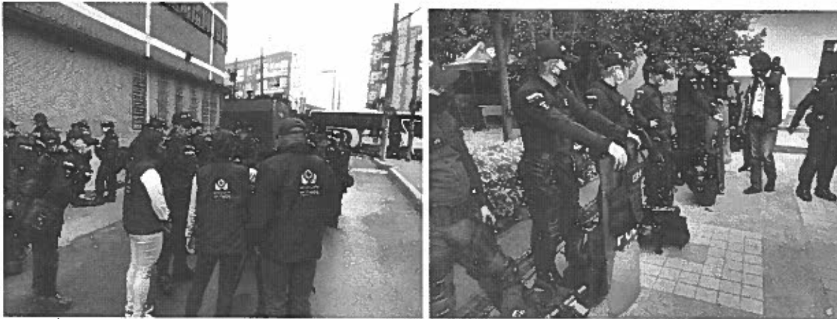
Revisión ESMAD 9 de abril 2021, ciudades de Bucaramanga y Bogotá.

Igualmente, la funcionaria enlace de la Defensoría del Pueblo estuvo en contacto permanente con el oficial de enlace asignado por la Policía Nacional, quien remitió oportunamente el listado de comandantes asignados para todo el país en esta fecha, 5 y se ubicó en el PMU, instalado en la Dirección General de la Policía Nacional- CAN, acompañando y monitoreando el desarrollo de las manifestaciones en las distintas regiones del país, enviando reportes cada dos horas sobre las situaciones monitoreadas. Es importante mencionar que de manera general los manifestantes a nivel nacional ejercieron su derecho de manera pacífica, sin que se evidenciaran comportamientos contrarios a la convivencia.