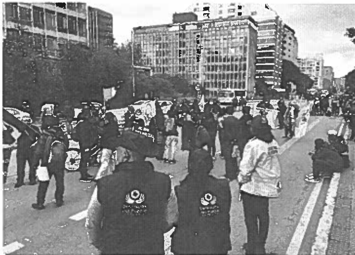
Acompañamiento Defensoría del Pueblo el 9 de Abril en la ciudad de Bogotá.

Según información recolectada en el PMU Nacional, el 9 de abril se presentaron manifestaciones en más de 10 departamentos, con una participación aproximada de 735 personas, sin que se generaran alteraciones al orden público 6 .