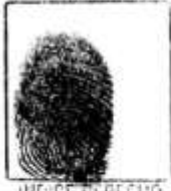
IMPRESIÓN DE LA HUELLA